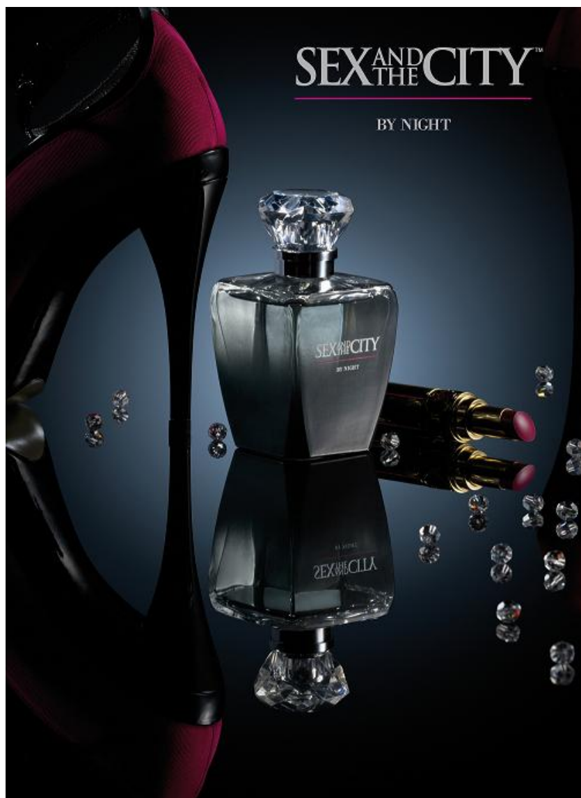
Презентация Sex and the City Fragrances {gallery}sex and the city{/gallery}

Четвъртък, 20 Февруари 2014г. 11:10ч. - Последна промяна Понеделник, 30 Септември 2019г. 10:52ч.